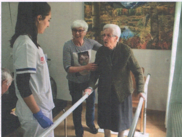
Residencia Fuente de la Salud, en Padul

Entrando en un espacio más preventivo, mantenemos un fuerte compromiso en la promoción del envejecimiento activo, con el objetivo de mejorar las relaciones afectivas y humanas, evitar el aislamiento y retrasar la dependencia. Esta línea de trabajo queda recogida en las diferentes actividades. Entre ellas destacamos: Programas culturales, turísticos, de ocio y convivencia. Agrícolas, a través de huertos. Acompañamiento en el domicilio. Envejecimiento saludable y Mayores en red.