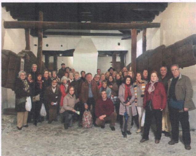
Miembros de ALUMA en la Ruta Zayas

Entrando en un espacio más preventivo, mantenemos un fuerte compromiso en la promoción del envejecimiento activo, con el objetivo de mejorar las relaciones afectivas y humanas, evitar el aislamiento y retrasar la dependencia. Esta línea de trabajo queda recogida en las diferentes actividades. Entre ellas destacamos: Programas culturales, turísticos, de ocio y convivencia. Agrícolas, a través de huertos. Acompañamiento en el domicilio. Envejecimiento saludable y Mayores en red.